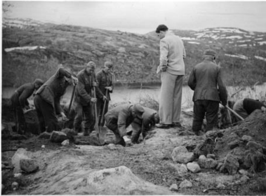
Bilde: Fra oppgravingen i juni 1945 ved Øvre Jernvann.

Sju av de ca. 20 SS-offiserer som hadde arbeidet i leirene Beisfjord og Øvre Jernvann ble arrestert og sendt til Beograd våren 1946. Alle fikk dødsstraff. Også norske vakter som hadde begått drap eller mishandlet fanger ble arrestert etter krigen og dømt.