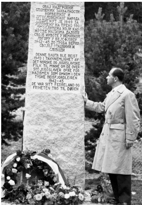
Bilde: Fra Beisfjord, 1949.

Et monument over jugoslavene ble satt opp i 1949 og står fremdeles der.