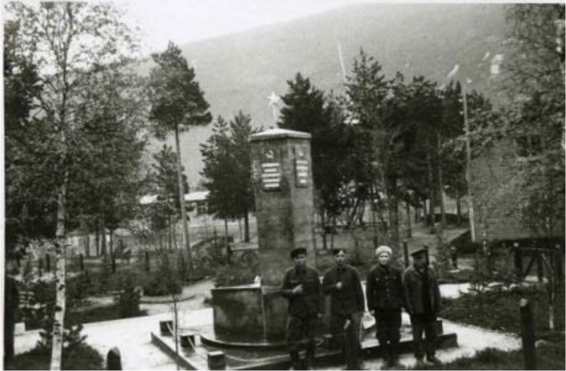
Bilde: Juni 1945. Foto av fire tidligere fanger foran den nybygde minnestøtten i Beisfjord.