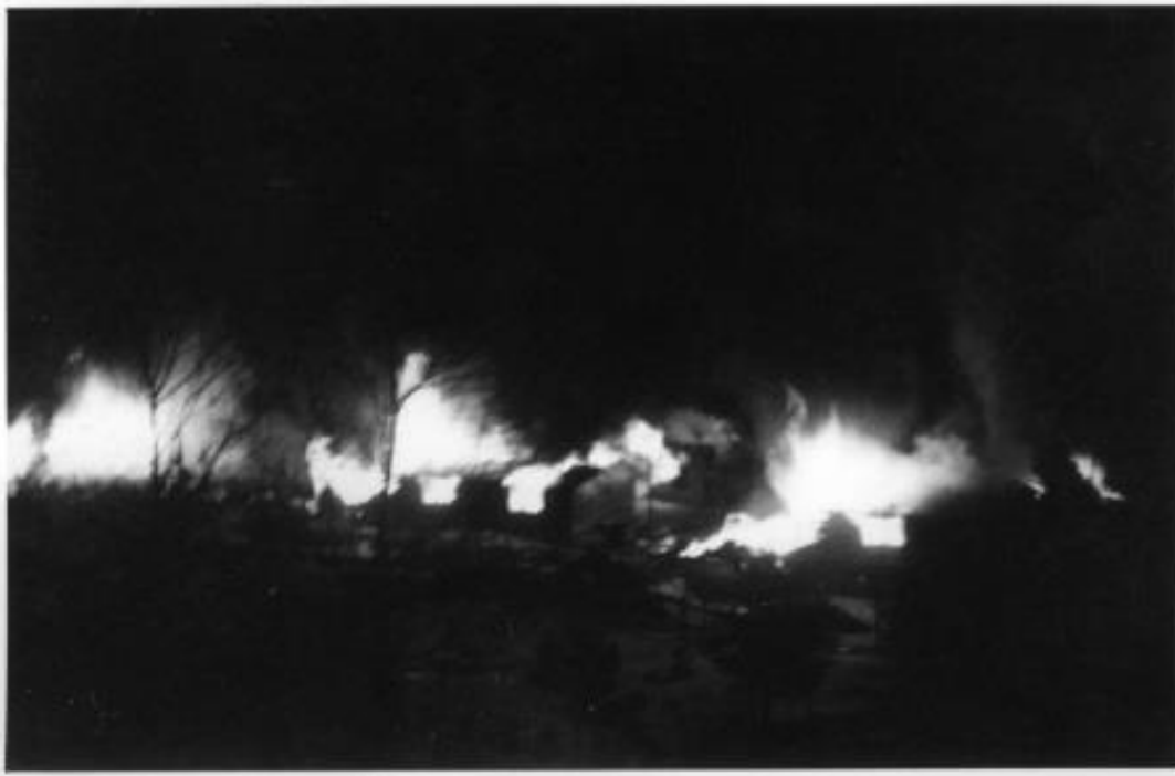
Bilde: Tre brakker brenner natt til 18. juli 1942.

Natt til 18. juli 1942 skyter og brenner SS 287 jugoslaviske fanger. Det blir den største massakre av fanger i Norge under andre verdenskrig.